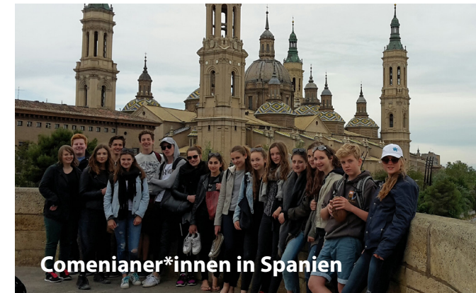
Comenianer*innen in Spanien